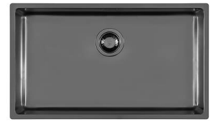
Lavello KE Soprato I Filotop Gun Metal 2157 056